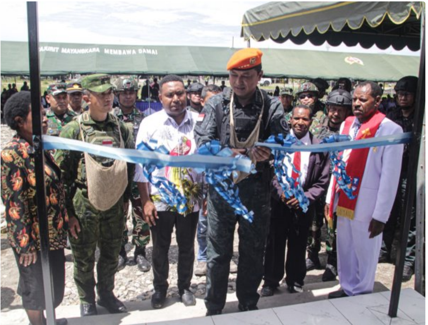
Foto: Kepala Staf Angkatan Udara (Kasau), Marsekal TNI Mohamad Tonny Harjono, S.E., M.M., meresmikan Gereja GPDI Mayangkara pada Rabu (12/02/2025).

NDUGA- Sebuah momen bersejarah terjadi di Kabupaten Nduga, Papua, ketika Kepala Staf Angkatan Udara (Kasau), Marsekal TNI Mohamad Tonny Harjono, S.E., M.M., meresmikan Gereja GPDI Mayangkara