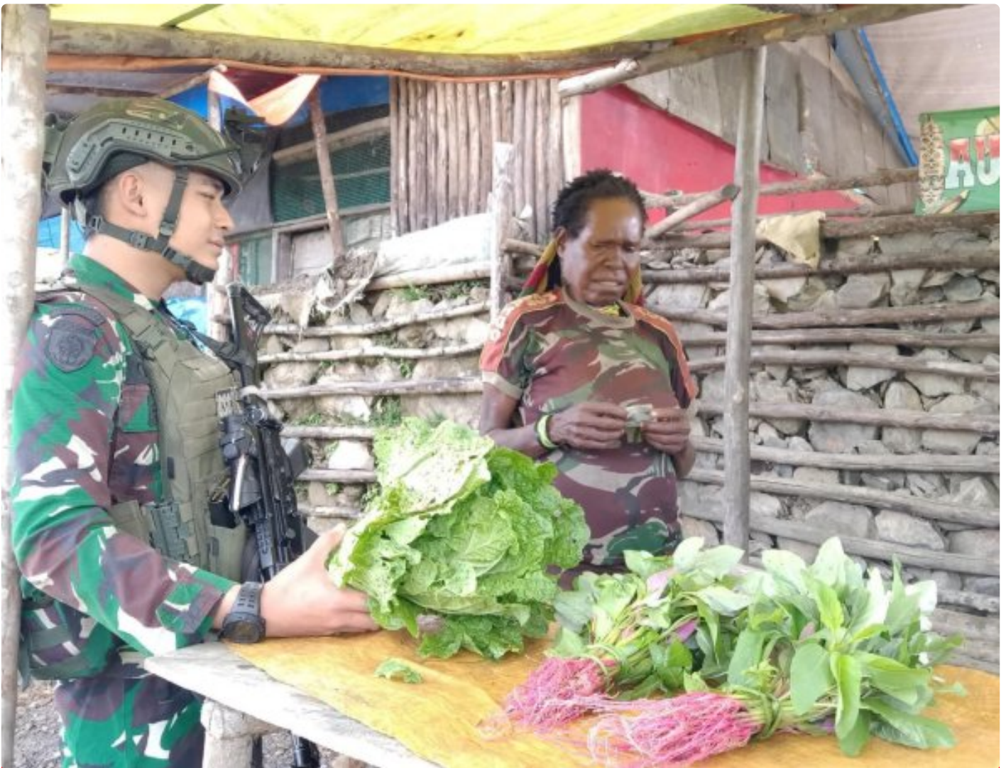
Prajurit TK Pintu Jawa Satgas Mobile Yonif 323/Buaya Putih Memorong hasil Tani mama Papua yang dijual di TK Pintu Jawa

Satgas Pantas Mobile Yonif 323 Buaya Putih Kostrad TK Pintu Jawa melaksanakan kegiatan ROSITA, kegiatan ini bertujuan untuk membeli hasil tani dari Mama-mama Papua yang datang ke TK Pintu Jawa sebagai wujud saling membutuhkan dan mendukung perekonomian warga setempat, yang