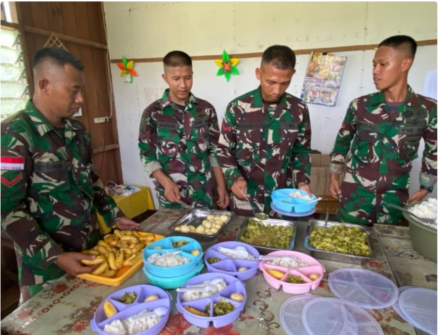
Foto: Dedikasi Satgas Pamtas Mobile RI-PNG Yonif 503/Mayangkara dalam mendukung program makan bergizi gratis pemerintah mendapat apresiasi tinggi dari masyarakat Distrik Krepkuri, Kabupaten Nduga, Papua, di sekolah rimba, Rabu (29/01/2025).

NDUGA- Dedikasi Satgas Pamtas Mobile RI-PNG Yonif 503/Mayangkara dalam