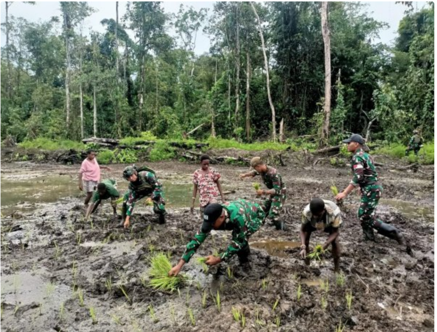
Foto: Satgas Pamtas Mobile RI-PNG Yonif 503/Mayangkara menggagas program ketahanan pangan yang melibatkan langsung warga Kampung Mumugu, Distrik Krekuri, Kabupaten Nduga, Selasa (07/01/2025).

NDUGA- Dalam upaya membangun kesejahteraan masyarakat di wilayah penugasan Papua Pegunungan, Satgas Pamtas Mobile RI-PNG Yonif 503/Mayangkara